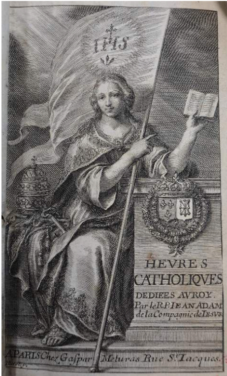
Fig. 2 : Jean Adam, Heures catholiques... , Paris, G. Meturas, 1656. Carpentras, bibliothèque Inguimbertaine, Rés. A 363. Gravure de G. Huret, IFF 405, état non décrit.