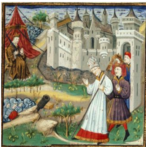
(14) Trahison de Calchas, British Library, Royal 16 F IX, f. 28r