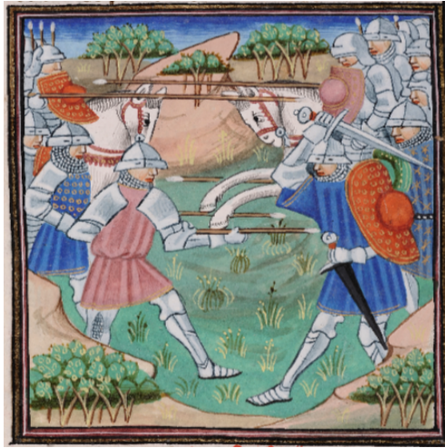
(10) Septième bataille, Bibliothèque royale, 9240, f. 58v