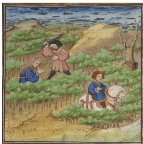
(6) Pyrrhus assassine Philistenés, BnF, fr. 22553, f. 114v