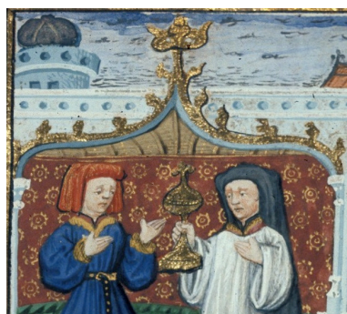
(Le vol du Palladion (détail), Historia Destructionis Troiae (trad. fr.), British Library, Royal 16 F IX, fol. 81r)

Édition critique de la première traduction française de l' Historia Destructionis Troiae de Guido delle Colonne