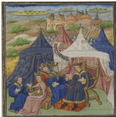
(4) Concertation des chefs grecs, BnF, fr. 22553, f. 67r