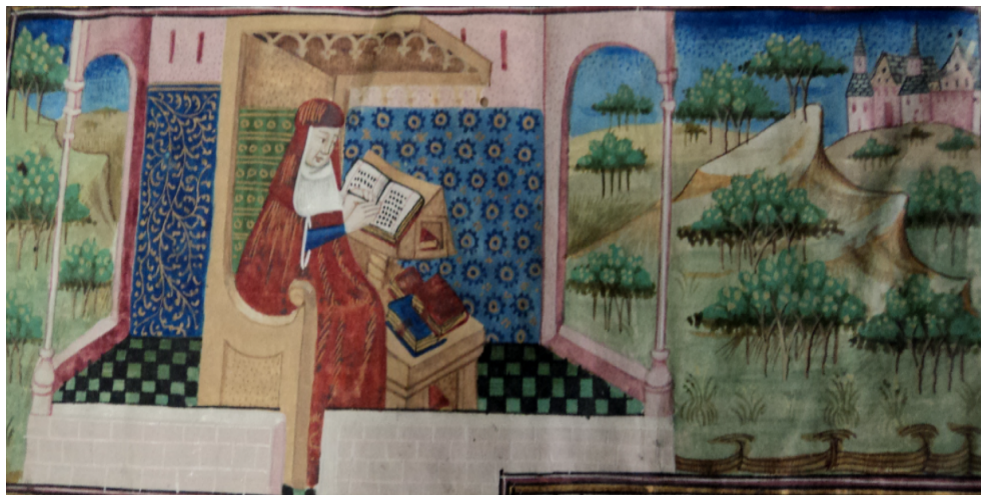
(7) Guido écrivant, Bibliothèque royale, 9240, f. 1r