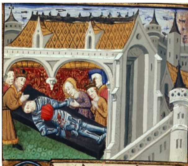
(17) Lamentations sur le corps d'Hector, British Library, Royal 16 F IX, f. 58r