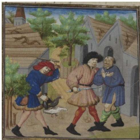
(3) Pillage en Mysie, BnF, fr. 22553, f. 59r