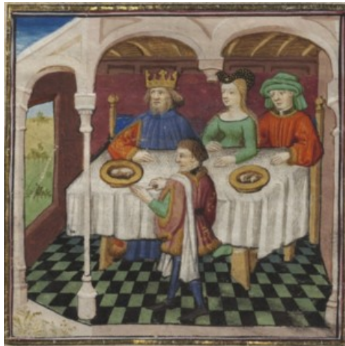
(1) Banquet chez Oëtès, BnF, fr. 22553, f. 7r