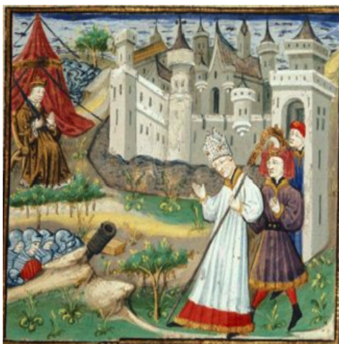
(14) Trahison de Calchas, British Library, Royal 16 F IX, f. 28r