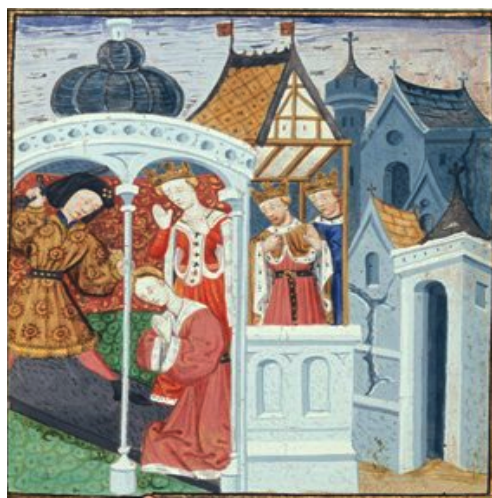
(18) Mort de Polyxène, British Library, Royal 16 F IX, f. 85r