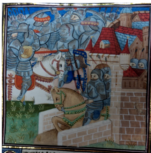
(9) Deuxième bataille, Bibliothèque royale, 9240, f. 44v