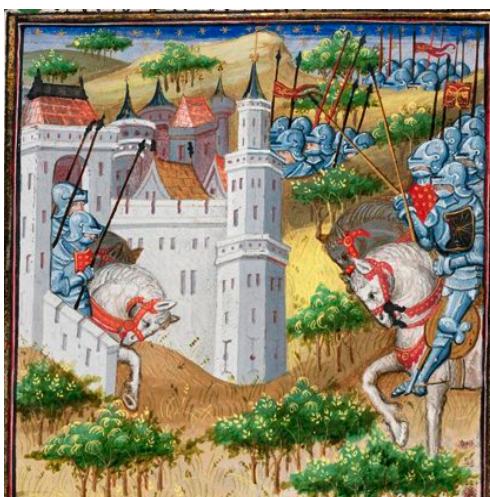
(15) Troyens et Grecs s'apprêtent à s'affronter, British Library, Royal 16 F IX, f. 39r