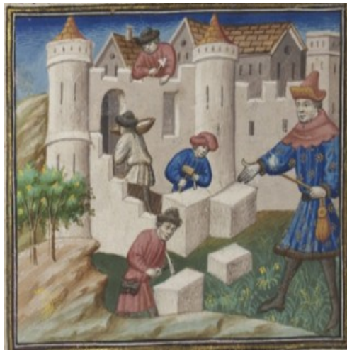
(2) Reconstruction de Troie, BnF, fr. 22553, f. 20v