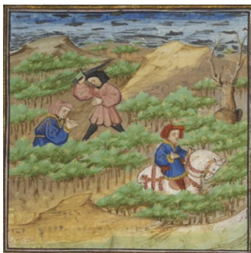
(6) Pyrrhus assassine Philisténés, BnF, fr. 22553, f. 114v