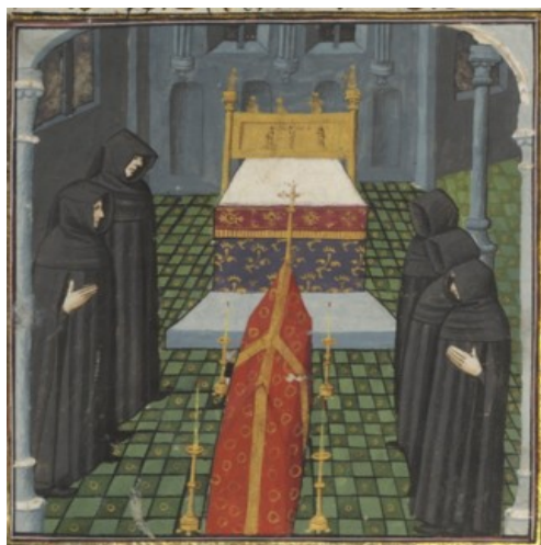
(5) Veillée funèbre, BnF, fr. 22553, f. 104v