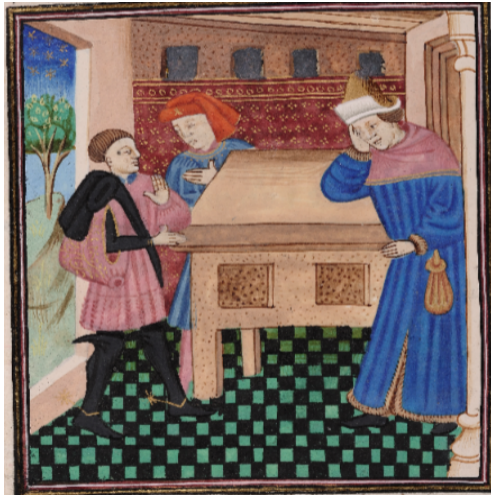
(11) Achille se lamentant, Bibliothèque royale, 9240, f. 65r