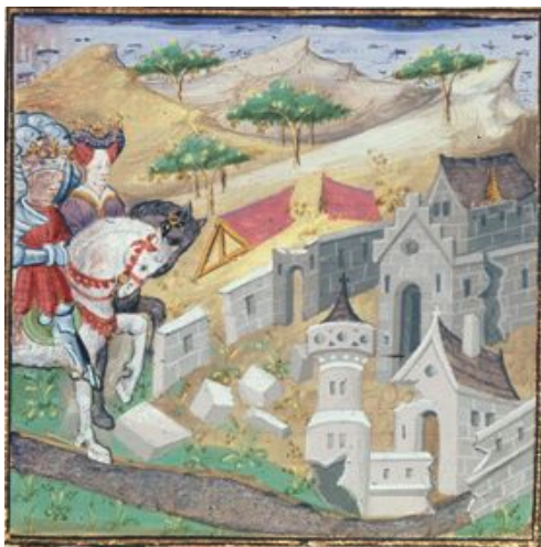
(13) Priam revient à Troie, British Library, Royal 16 F IX, f. 11v