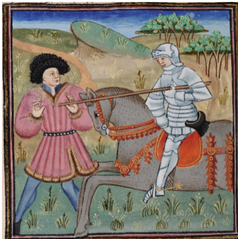
(12) Mort de Troilus, Bibliothèque royale, 9240, f. 71v