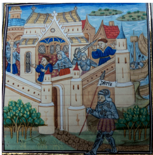
(8) Sac du temple de Vénus à Cythère, Bibliothèque royale, 9240, f. 26r