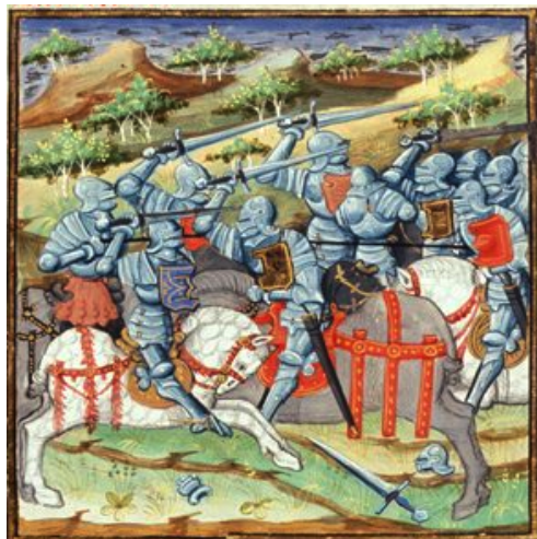
(16) Quatrième bataille, British Library, Royal 16 F IX, f. 48v