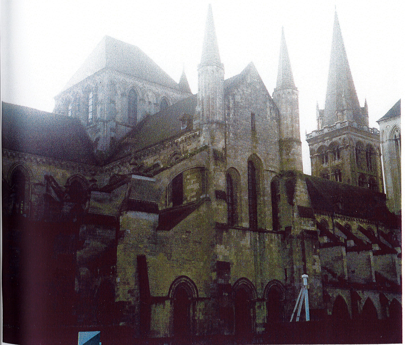
1) Vue générale de la cathédrale par le transept nord