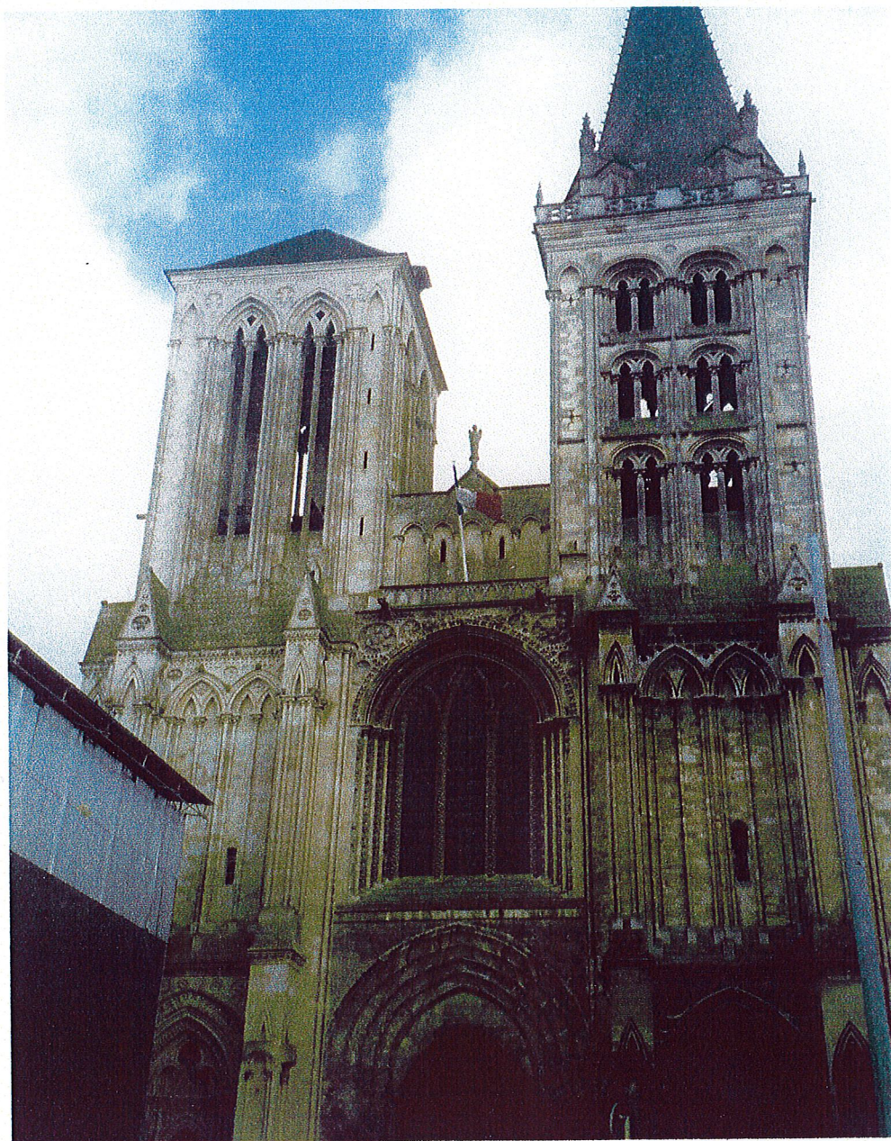
2) Façade de la cathédrale